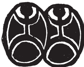
Сливането на астралните близнаци

Енергийният организъм на астралните близнаци