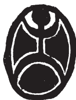
Знак за здрава и защитена аура

зирането на защитната обвивка за по-ефективно, но ако в началото не вярвате особено на представната си способност, уповавайте се на камъка. Той определено прави аурата по-плътна* и възпрепятства бързото изчерпване на енергията. Нарисуваният от мен символ на силата е подходящ за талисман. Той ще ви помогне, ако имате трудности с визуализирането и не успявате да си представите своята обвивка. Направете си копие, влезте в медитативно състояние и го гледайте, докато се изпълните с чувство за сигурност и защитеност. Повтаряйте упражненията, за да се запечата той трайно в съзнанието ви досущ пътен знак и само щом хвърлите поглед върху листчето, да се изпълвате със спокойствие. Символът е толкова елементарен, че ще го запомните без проблем и после по всяко време ще можете да го извикате пред вътрешния си взор.